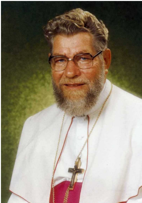
De in Uden geboren Mgr. Wilhelmus van den Elzen.

Hij is overleden te Gent (België) op 23 januari 2000.