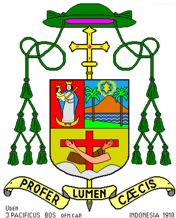
Wapenschild Mgr. Pacificus Bos. Getekend door Broeder Harrie Schellen m.afr.

boven de ster, het licht in de duisternis, en misschien ook wel de afbeelding van het licht ( Lumen ) in zijn wapenspreuk Profer Lumen Caecis , geef het licht aan de blinden, hier worden waarschijnlijk de "heidenen" bedoeld. De spreuk komt uit de derde strofe van het "Ave Maris Stella" gezang.